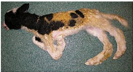
Zakażenie SBV – zaburzenia rozwojowe płodów –